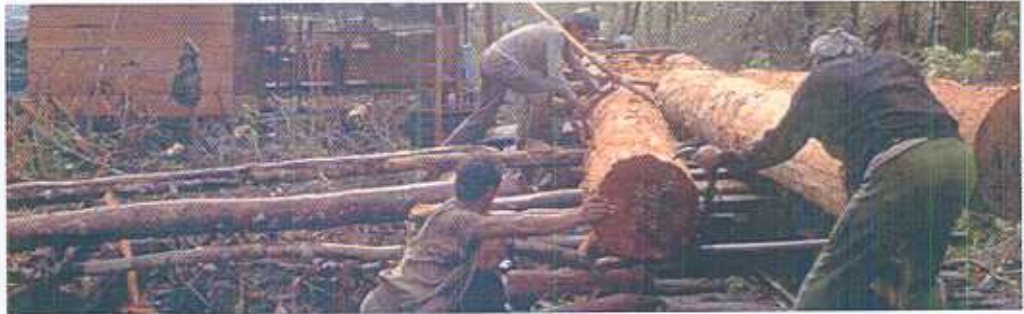
P. v. Cardingen/FRP

подорваны, если страны ЕС продолжат закупки нелегальной древесины из этих регионов.