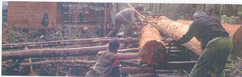
P. v. Cardingen/FRP

некоторые потенциальные недостатки двусторонних соглашений. Европейская комиссия надеется, где возможно, основывать деятельность на двусторонних соглашениях, и обеспечить региональные добровольные соглашения о партнерстве с регионами, где незаконные лесозаготовки представляют угрозу для нескольких стран. Где это возможно, ЕС будет продвигать межрегиональные подходы ФЛЕГТ в региональных торговых переговорах.